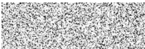
ředitel katastrálního pracoviště

PÚ zajistí, že výsledná data KoPÚ (předávaná po jednotlivých etapách) předá zpracovatel pozemkovému úřadu a ten po provedení kontrol katastrálnímu pracovišti podle ust. § 57 KatV. Elektronicky pak ve struktuře přílohy č. 56 Návodu. Data musí být ověřena autorizovaným zeměměřickým inženýrem v předepsaném rozsahu v podobě elektronické případně i analogové. PÚ předá KP výsledná data včetně jím provedených kontrol.